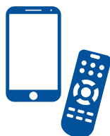
Teléfonos y controles remotos