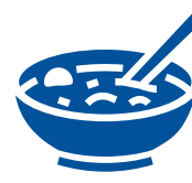
Prepare o coma alimentos