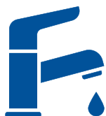
Llaves y grifos de agua