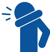
Tosa o estornude