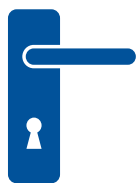
Manijas o perillas de puertas

Use agua y jabón, alcohol al 70%, o cloro diluido (4 cucharaditas por un cuarto de agua):