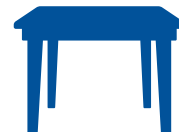
Mesas y otras superficies