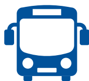
Utilice transporte público